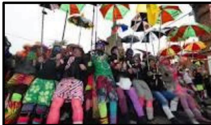
Carnaval de Dunkerque UNESCO (documentation de l'UNESCO) Carnaval : une tradition bien ancrée

La tradition du carnaval née pendant l'époque médiévale perdue et vit toujours au XXI e siècle avec autant de succès et d'engouement. Alors se pose cette question : qu'est-ce que cette fête universelle procure à ses participants dans le monde entier pour traverser le temps ? Si pour certains le carnaval est un pan entier de leur culture, pour d'autres qui l'ont découvert par hasard, ce sont ses valeurs qui les ont séduits, plus que le masque.